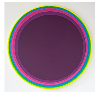
Jan Kaláb: «Bern», 2016, Acryl auf Lwd., Dm 150 cm, 7500 Franken (Galerie Rigassi by SOON).