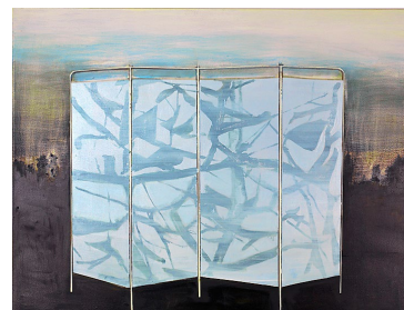
Kotscha Reist: «Paravan», 2016, Öl auf Lwd., 135 x 160 cm, 16 000 Franken (Galerie Bernhard Bischoff & Partner).